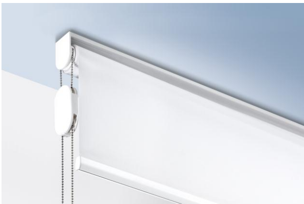
Silent Gliss child safety device – pour la sécurité absolue

Innovation par Silent Gliss – pour plus de sécurité dans le privé