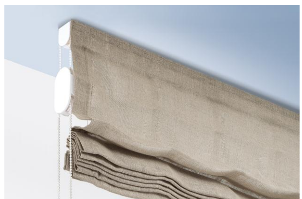
Rideau drape avec contrepoid "child safety device"