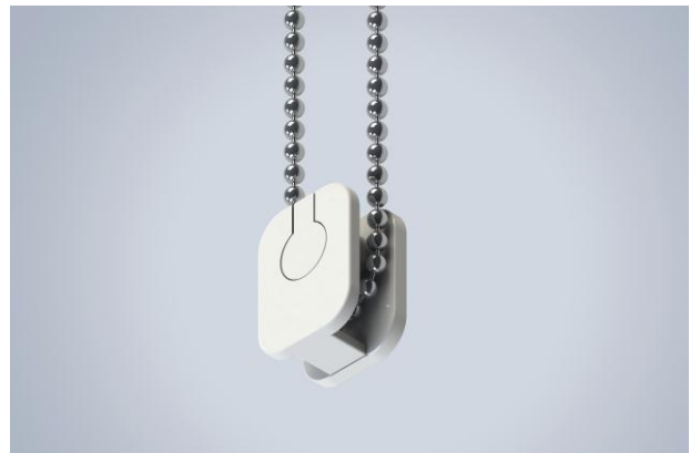
Contrepoid de sécurité standard